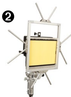
adapter brackets / Adapter-Klauen